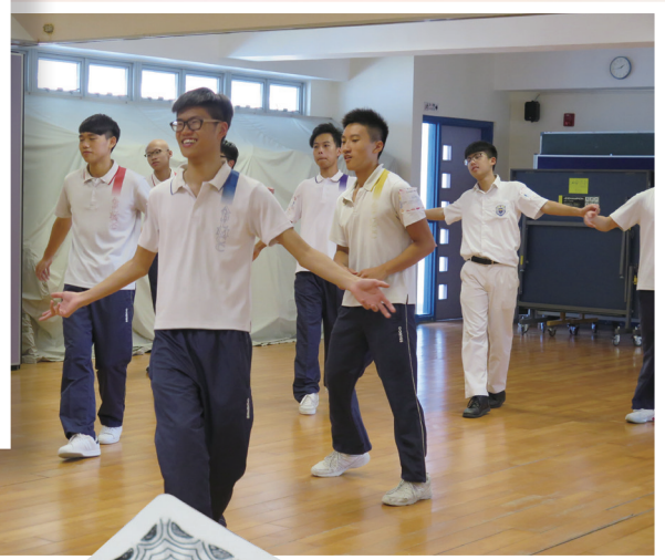
正向街舞體驗鬆一鬆