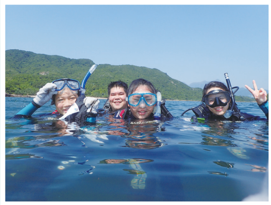
參與珊瑚普查，潛水隊員樂在水中