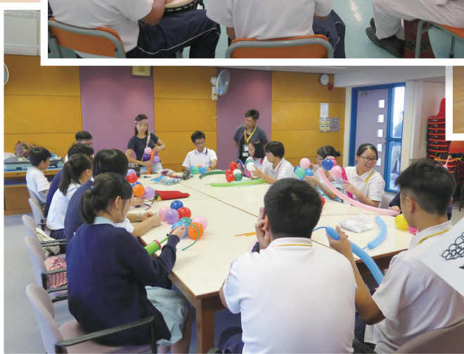
Balloon On Air