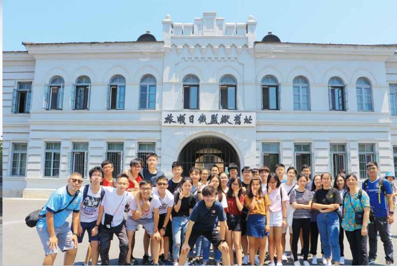
藉參觀日俄監獄舊址，學生更了解日、俄兩國在晚清及近代中國東北地區的爭奪。