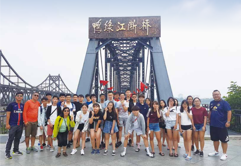
遊覽鴨綠江斷橋遺址，學生能深刻體會戰爭的破壞及和平的可貴。