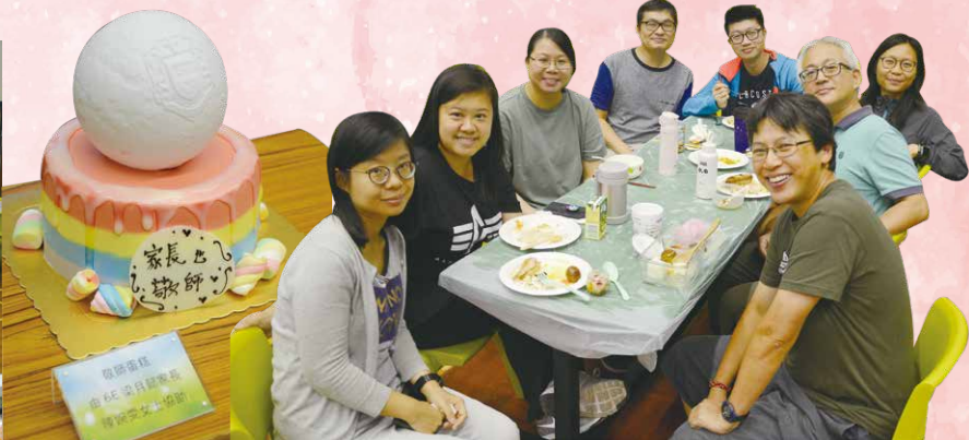
別出心裁的敬師蛋糕