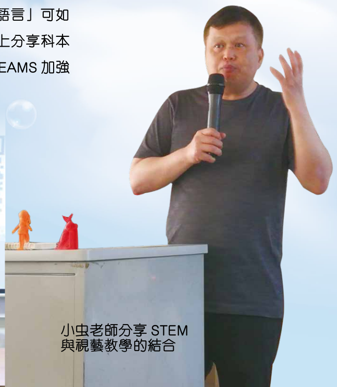
小虫老師分享 STEM 與視藝教學的結合