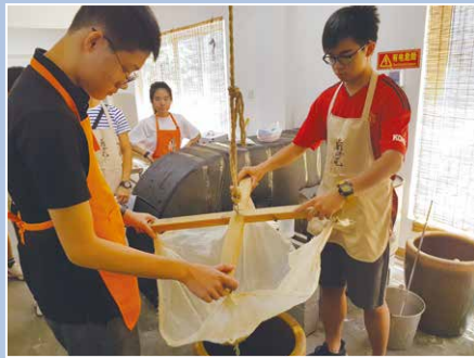
學生 DIY 東北地道美食 鹵冰花豆腐

為擴闊學生眼光，欣賞我國著名風景區，認識傳統文化及中國近代歷史的發展，其他學習經歷統籌組及歷史學會聯合舉辦為期六日五夜的「大連及丹東歷史文化考察之旅」。