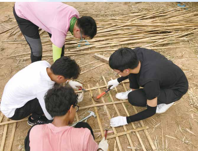
建屋 — 萬事起頭難

德育及公民教育組於 2019 年 7 月 2 日至 7 日帶領本校義工隊前赴柬埔寨。在暹粒 Kompheim Village 協助重建房屋及建設直立種植園予有需要家庭，並參與該村的社區服務；體驗柬菜烹飪，參與雜耍工作坊、陶瓷工作坊和遊覽吳哥窟。