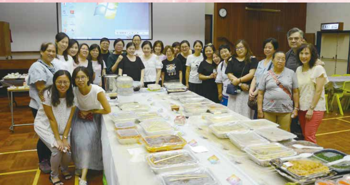
家長團隊全情投入炮製美食

為發揚尊師重道的優良傳統文化，及為莘莘學子樹立一個良好的敬師榜樣，家長教師會於2019年8月20日舉辦「家長也敬師宴」。當日一班家長及學生用心烹調很多中外美食，表達對全體教職人員的謝意。