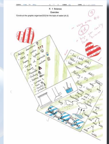
學生利用 GO、腦圖總結所學