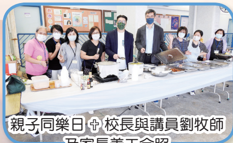
親子同樂日 + 校長與講員劉牧師及家長義工合照