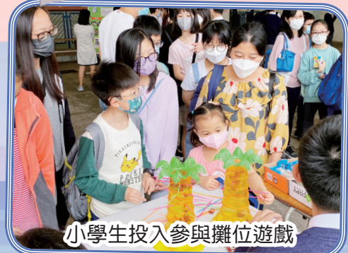
小學生投入參與攤位遊戲