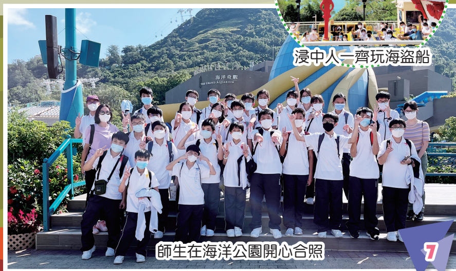
浸中人一齊玩海盜船