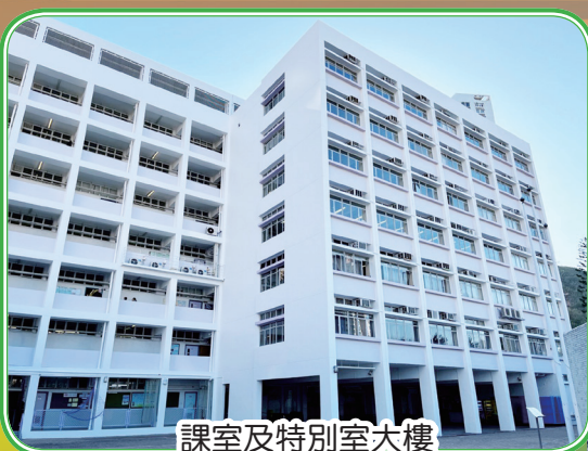
課室及特別室大樓