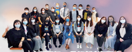
老師團契 + 歡迎新老師聚會

感謝主！本年舉行的「立約日」讓一眾基督徒師生濟濟一堂立約在校園內作鹽作光。另外，今年由老師和傳道親自訓練學生團契的職員，他們好好接受裝備，學習委身服侍。而每年一度的「感恩日」，感恩卡上的心聲、感謝老師職員的禮物已送到師生的手，也願讚美神的歌聲溫暖眾人的心，一起實踐聖經的教導「凡事謝恩」！我們很高興在第一次老師團契聚會中歡迎一班新老師，看看！他們多青春和充滿活力！也不忘「親子同樂日」精彩豐富的節目，當日老師、家長和學生享受樂也融融的一天，感謝主賜下豐足的恩典！