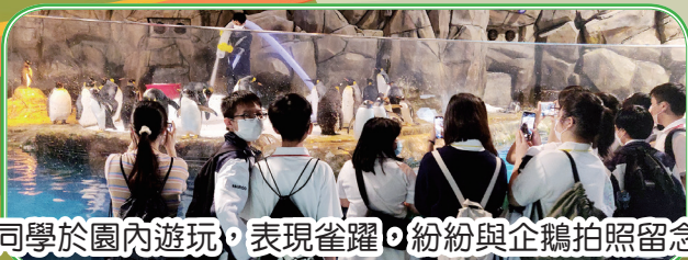
同學於園內遊玩，表現雀躍，紛紛與企鵝拍照留念

久違了的旅行日終於在2022年11月10日順利舉行。天公造美，全校師生於海洋公園歡聚暢遊，輕鬆愉快度過一天。