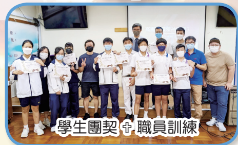
學生團契 + 職員訓練