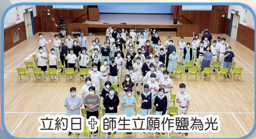
立約日 + 師生立願作鹽為光