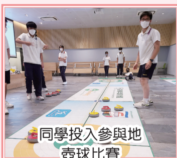
同學投入參與地壺球比賽

歷奇活動旨在讓參與者挑戰自己，突破自我。當中必不可少的元素就是團隊精神。在這次歷奇活動中，我們分別進行了不同的環節，包括：繩網挑戰、新興運動、野外定向以及工作坊。當中最令我印象深刻的活動就是野外定向。在該活動中，我們需要到達不同的得分點，回答各式各樣的問題，才能成功得分。活動考驗我們規劃、溝通的能力，雖然在這個活動中，我組並沒有獲勝；導師與我們進行檢討時，有助我們反思自己的不足，並作出改善。此外，在這兩天的活動中，我體驗了各種未曾接觸過的運動，例如：芬蘭木棋、地壺球等等。各活動都具吸引力，我們都投入參與。不論能否在比賽中獲勝，這些活動都令我大開眼界；而繩網活動亦培養了我迎難而上的精神。這次歷奇活動的內容充實，感謝導師兩日的帶領和教導。