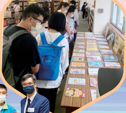
家長與學生參觀圖書館