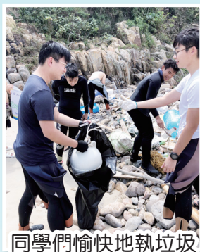
同學們愉快地執垃圾