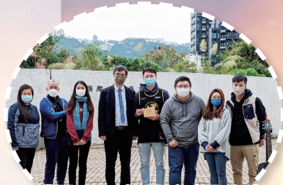
感恩日 + 午間詩歌分享會