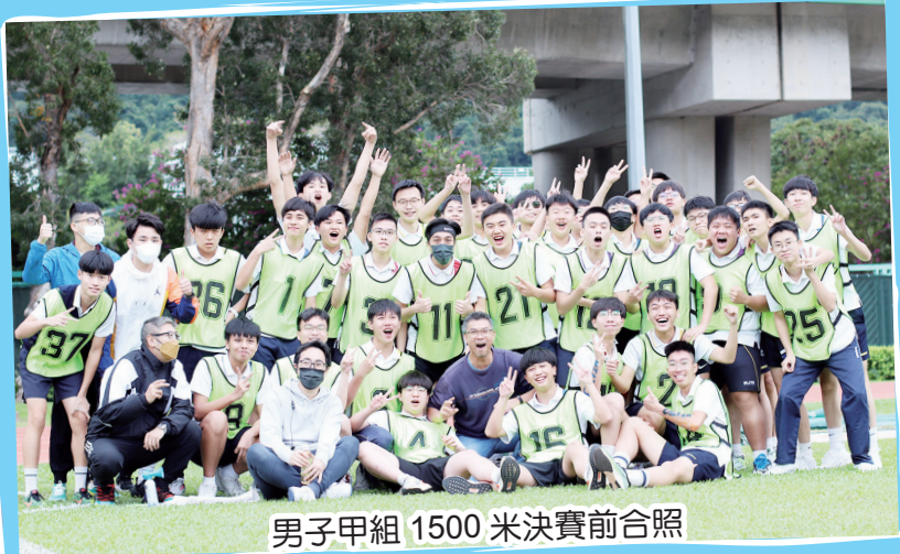
男子甲組 1500 米決賽前合照