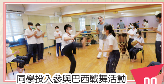
同學投入參與巴西戰舞活動

在這兩天巴西旅程中，我認識了巴西的文化，如飲食、流行運動等。這個旅程令我有著外出旅遊的感覺，過程十分開心。首天的第一個活動是沙灘排球，這個活動真的考驗我們的忍耐力。當天的天氣非常炎熱，氣溫高達38度，我們踩著沙子的時候，腳底就熱得像熱鍋上的螞蟻。但是我們為了完成任務，也要忍耐著腳底的痛楚。在活動中，透過與組員討論戰勝的策略時，我學會了溝通的重要。而連續兩天的巴西戰舞活動中，我們要整班人圍成一圈，教練唱著歌，有些同學在拍手和打鼓，而中間則有組員對決。我感受到巴西人的熱情，更重要的是整個活動都充滿能量，緊張的比賽氣氛都變得輕鬆。另外，平日我們很少機會接觸到巴西的食物。這兩天的午餐能讓我們嚐到味道比較特別的巴西食物；當然我們也有嘗試烹調吧，感覺新奇。巴西教練非常熱情，經常跟我們開玩笑。總括而言，這兩天的體驗真的令我開拓了眼界。