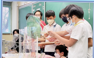
同學嘗試以自己製作的皮影道具進行表演