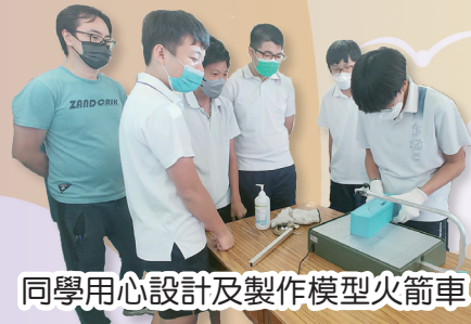
同學用心設計及製作模型火箭車

今年的中三全方位學習周的活動是製作火箭車，開始前我感到忐忑，因我在手工方面較笨拙，擔心沒法順利完成。開始製作火箭車時，我們組沒有甚麼創意，唯有先做好火箭車的每一步，再想美術設計方面。最後，我們盡力為火箭車做了一些小設計，便拿著它去比賽。在比賽時，看到同學們充滿創意的設計，非常有趣。其實，我並沒有想過我們可以拿到季軍。今次得獎是因為我們對火箭車的興趣，有共同目標。從中我學到團體合作的重要性，也對火箭車製作充滿好奇，得獎亦令我倍感被肯定，滿有成就感。