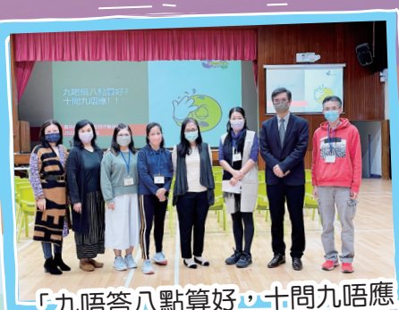
「九唔答八點算好，十問九唔應」 工作坊