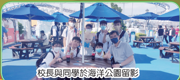
校長與同學於海洋公園留影