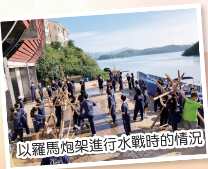
以羅馬炮架進行水戰時的情況

最後，導師在我們離開前，送給我們「PDCA」四個英文字，意思是「Plan, Do, Check, Action」代表每個團體活動都需先計劃，嘗試和檢查，最後是實踐。這次的訓練營真令我們獲益匪淺！