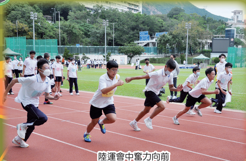
陸運會中奮力向前