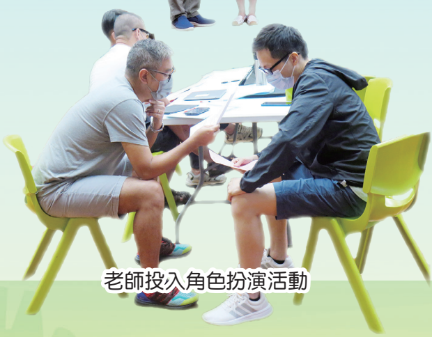
老師投入角色扮演活動