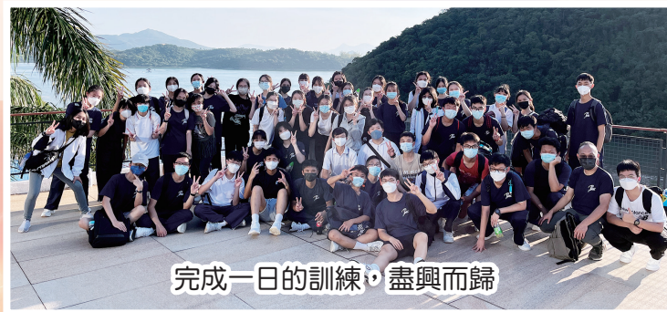
完成一日的訓練，盡興而歸