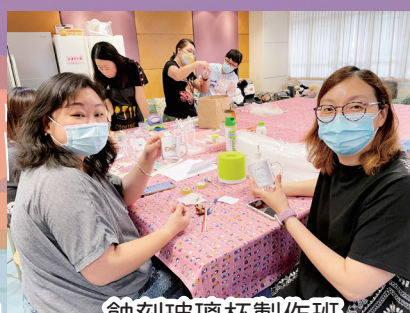
蝕刻玻璃杯製作班