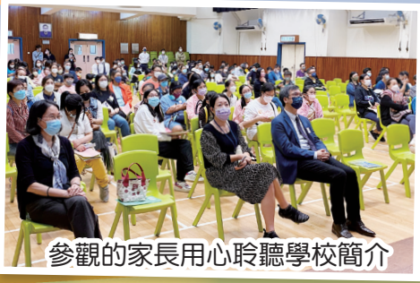
參觀的家長用心聆聽學校簡介