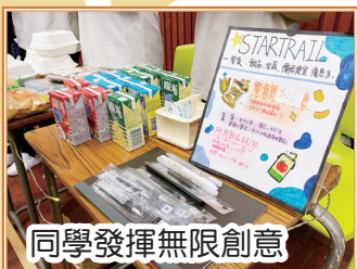
同學發揮無限創意

面試技巧對我來說是很實用的技能，無論是在校內或校外的各種大大小小的面試，或是在兼職時的面試，我都能學以致用。例如：懂得如何介紹自己的優點，要提前做好面試準備，了解清楚這份工作或學科需要怎樣的人才。另外我還學會了要善於利用提問機會，表現自己。