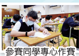
參賽同學專心作賽