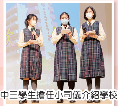
中三學生擔任小司儀介紹學校

在家長教師會攤位前，參觀的家長熱心發問；在數學及英文遊戲攤位前，小學生們投入玩耍。而擔任工作人員的浸中學生在介紹學校及帶領來賓參觀的工作中，表現出色，落落大方。總括而言，這次活動除了呈現美觀的校舍設施外，還呈現了學生優秀的一面，可謂內外兼備。