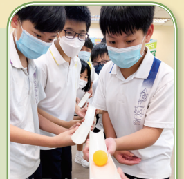
同學聚精會神地參與訓練集中力的活動

在這兩天的訓練中，我感到自己有點改變。遊戲中快樂輕鬆的氣氛往往隱藏着一絲危險，因此導師一直強調著要注意安全。第一天的木板遊戲是考驗大家的溝通、合作和信任。第二天的任務更艱難了，還夾雜著甜酸苦辣。「甜」是大家為青春留下了美好回憶；「酸」是在遊戲中拖累了大家而感到愧疚；「苦」是大家在困難中一步一步走出來；「辣」則是被火辣辣的太陽伯伯曬得通紅。無論結果如何，大家都樂在其中！很慶幸有這樣的活動令彼此的成長過程更加充實呢！