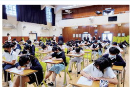
書法比賽場面盛大