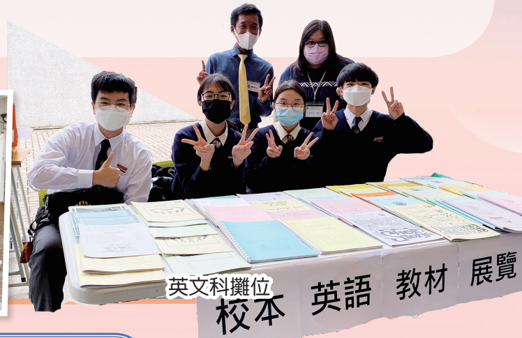
英文科攤位 校本 英語 教材 展覽