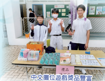
中文攤位遊戲獎品豐富