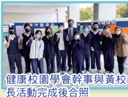
健康校園學會幹事與黃校長活動完成後合照