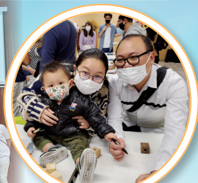
校友攜同下一代認識母校