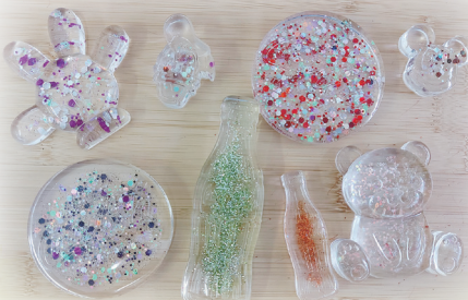
水晶膠製成品圖片