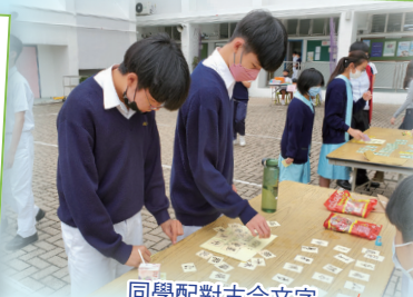
同學配對古今文字