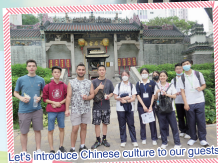
Let's introduce Chinese culture to our guests!