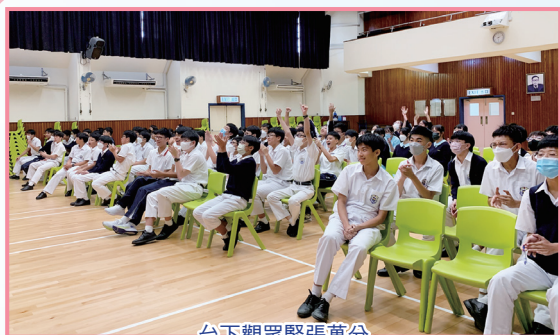
台下觀眾緊張萬分

事隔數年的初中歷史問答比賽於5月重新舉辦。為擴寬同學對歷史的認識，比賽範圍不局限於課本知識，更包括課本以外的歷史知識，學生獲益良多。