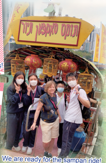
We are ready for the sampan ride!