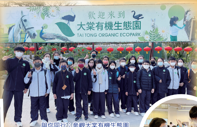
與你同行：參觀大棠有機生態園