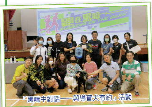
「黑暗中對話——與導盲犬有約」活動

家教會是家長與學校溝通的橋樑，希望各位家長在往後的日子都可以一同參與各項活動，反映意見，為學生爭取不同的權益，讓學校建立更美好的學習。