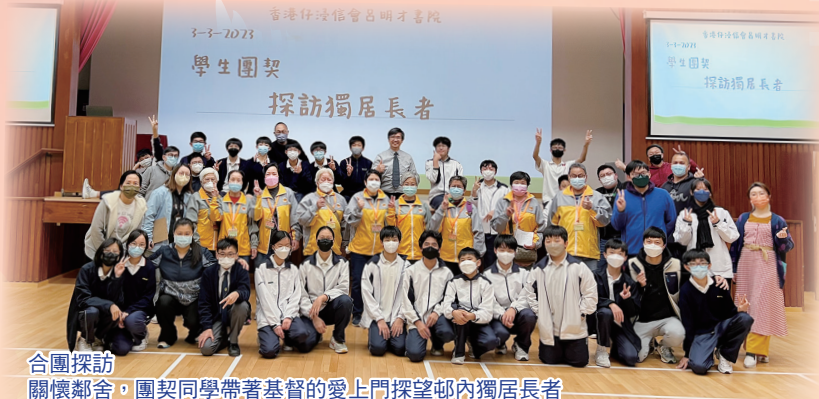
合團探訪 關懷鄰舍，團契同學帶著基督的愛上門探望邨內獨居長者