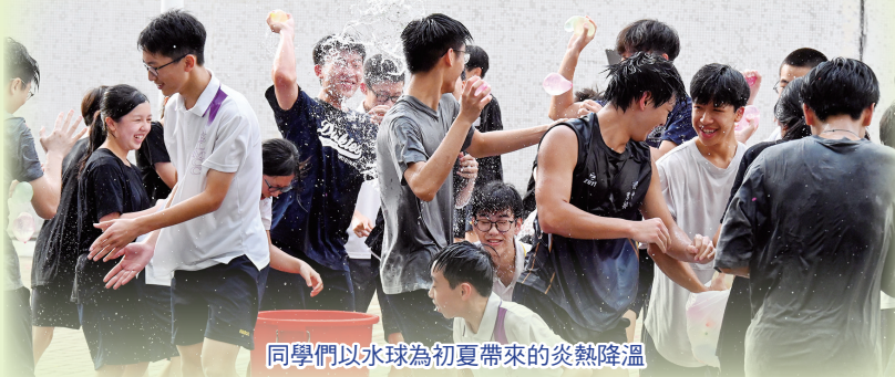
同學們以水球為初夏帶來的炎熱降溫

學生會於5月6日順利舉辦浸中Party-game，是次活動分為三個部分：水球大戰、Running-man以及燒烤聚餐，各人投入，氣氛熾熱。