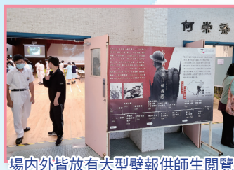
場內外皆放有大型壁報供師生閱覽

歷史學會於學校禮堂舉行以抗日戰爭與日佔香港為主題的大型專題展覽。希望透過大型展板、紀錄片播放、圖書展覽及攤位遊戲等活動培養學生的國民身份認同，讓學生反思戰爭造成的禍害，明白國家安全確實得來不易，同學有責任為國家安全出一分力。