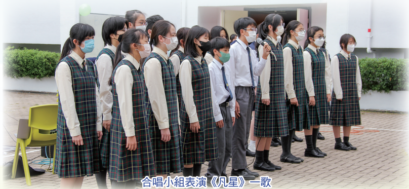
合唱小組表演《凡星》一歌

睽違數年的敬師宴於三月重新舉辦，當天共有十六班的師生聚首一堂，共享午餐。活動期間，有學生為大家表演，對老師獻上感謝。