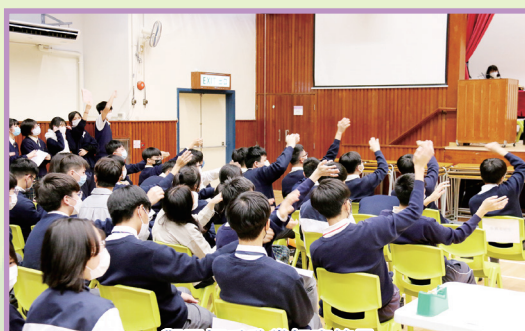
觀眾揮手欣賞初賽節目