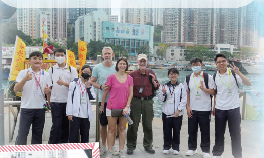
We are having a great time with the foreign visitors.

The event benefited both the visitors and our students. The visitors were greatly impressed with our students' enthusiasm and friendliness. It was great knowing more about the local culture and the life of Hong Kong teenagers. On the other hand, the student guides were also delighted by the valuable experience. They became more relaxed and confident in speaking English when exchanging ideas and views with the foreign visitors. Definitely, our students treasured the invaluable opportunity for an authentic language exchange. The positive and encouraging feedback from both the visitors and our student guides is undoubtedly a proof of the value of this learning activity.