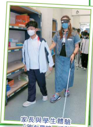
家長與學生體驗「跑在黑暗」活動