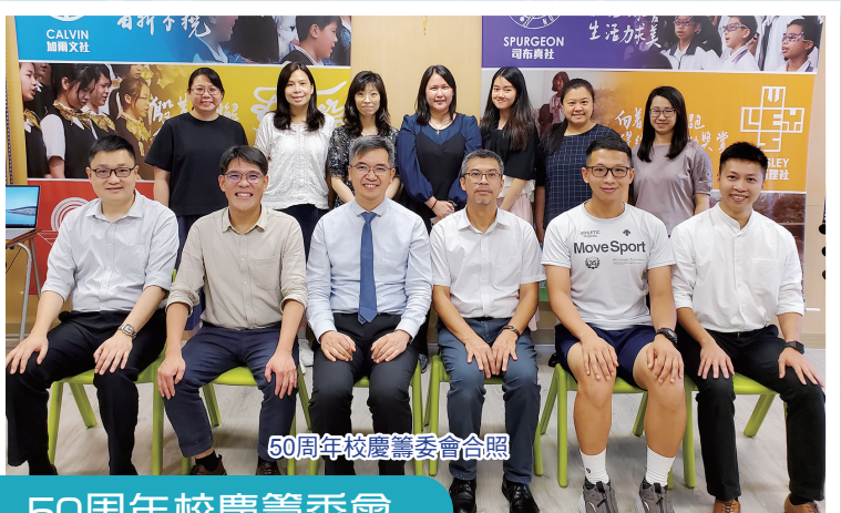
50周年校慶籌委會合照