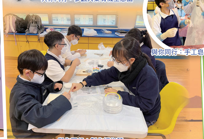
與你同行：製作拇指琴