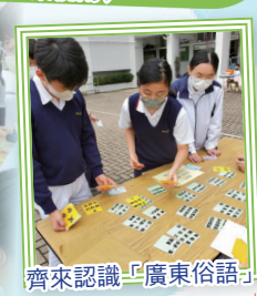
齊來認識「廣東俗語」