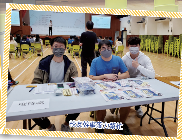
校友幹事落力幫忙