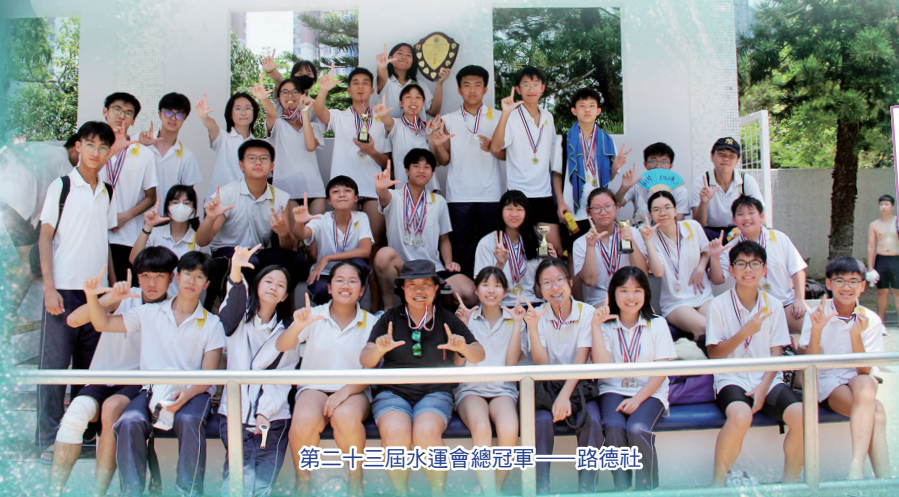
第二十三屆水運會總冠軍——路德社