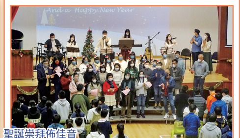
聖誕崇拜佈佳音 普天同慶，同頌救主耶穌降生