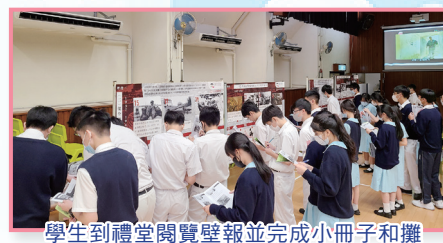
學生到禮堂閱覽壁報並完成小冊子和攤位問答遊戲。