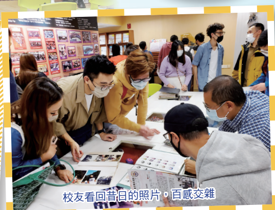
校友看回昔日的照片，百感交雜