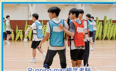
Running-man極度考驗參與者的反應和體力