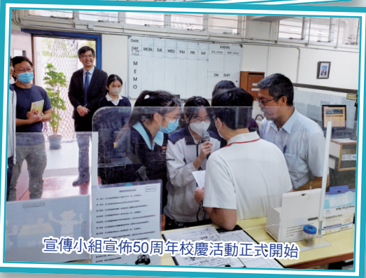
宣傳小組宣佈50周年校慶活動正式開始