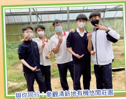
與你同行：參觀清新地有機悠閒莊園