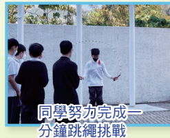
同學努力完成一分鐘跳繩挑戰