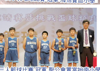
男子三人籃球比賽 冠軍 聖公會置富始南小學