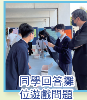
同學回答攤位遊戲問題