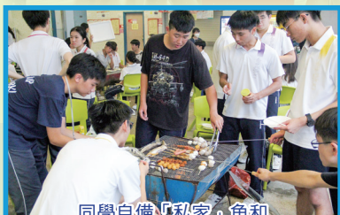
同學自備「私家」魚和肉串燒，使人垂涎三尺