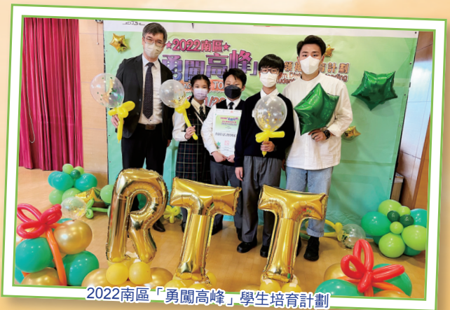
2022南區「勇闖高峰」學生培育計劃

本年度參與由香港仔坊會舉辦的「勇闖高峰」學生培育計劃，讓學生建立積極與健康的人生觀。