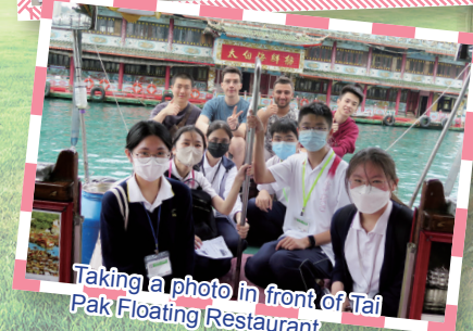
Taking a photo in front of Tai Pak Floating Restaurant