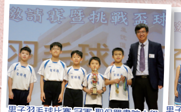
男子羽毛球比賽 冠軍 聖保羅書院小學