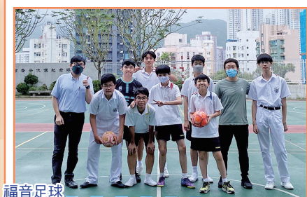
福音足球 康體鍛煉，訓練球技也學習團隊精神，彼此欣賞