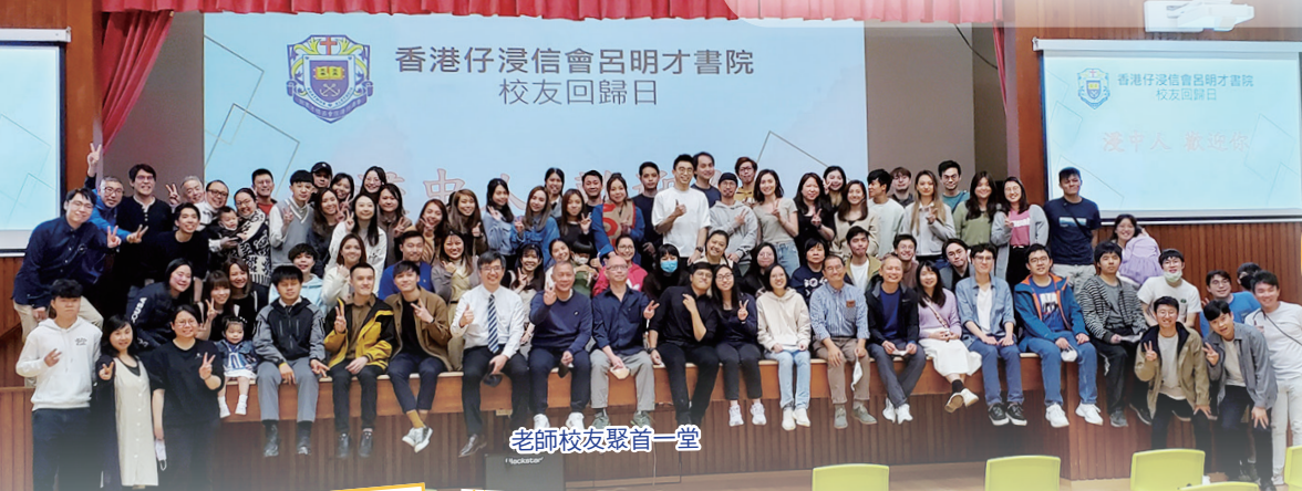
老師校友聚首一堂

校友回歸日已於2023年2月11日圓滿舉行，當天場面熱鬧，笑聲滿載，老師、校友均盡興而歸。當天有接近八十人出席，出席人數可算是創近幾年的新高。期望下一次的聚會，能見到更多校友回來相聚吧！