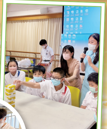
與你同行：層層疊大挑戰