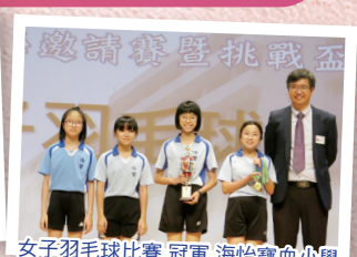
女子羽毛球比賽 冠軍 海怡實血小學