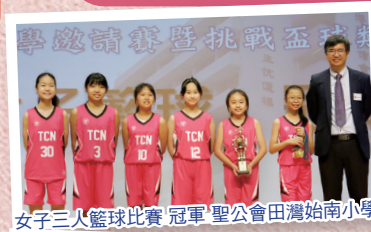
女子三人籃球比賽 冠軍 聖公會田灣始南小學

本屆「小學挑戰盃」三人籃球賽有5間小學參與，共派出7支隊伍。而羽毛球比賽則有5間小學參與，共派出8支隊伍。小健兒們表現積極，努力爭取優異成績，令人可喜！