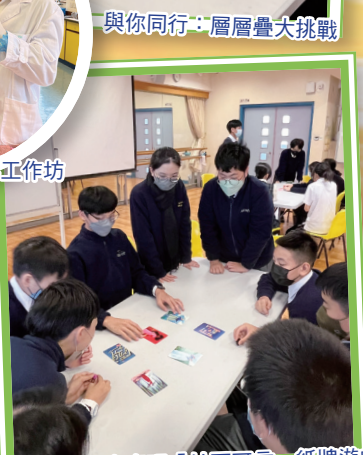
與你同行：齊齊玩「妙不可言」紙牌遊戲