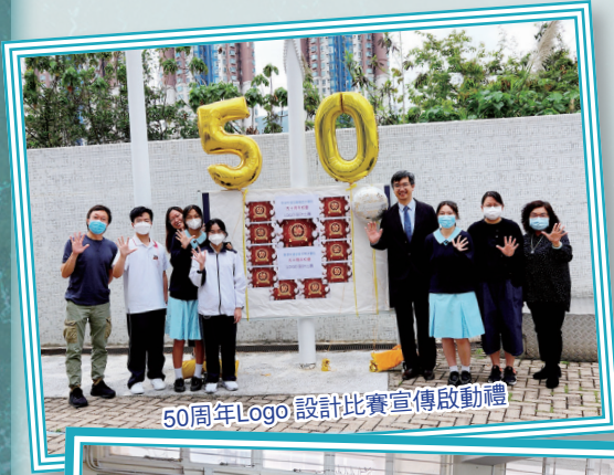
50周年Logo設計比賽宣傳啟動禮

浸中50周年的主題為「五十盛載 延展其才」——「浸中50年來盛載了各式各樣的人、事、物，今延續歷年建立的成果，開展下一個里程碑。」隨著各項慶祝活動的開展，由黃校長領導的50周年校慶籌委會已經成立。而首個慶祝的活動就是「五十周年校慶LOGO設計比賽」，比賽分別設有學生組和公開組，讓校董、校長、老師、家長、學生、校友，以致大眾都有份參與是次慶典。而其他的慶祝活動將陸續舉行，期望透過所附的照片，讓大家率先感受歡欣雀躍的氣氛。