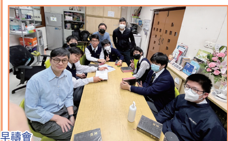
早禱會 同心禱告，每天早上先來到神面前靈修和禱告交托

哈利路亞！我們讚美 神的恩典豐豐足足與浸中的師生同在，願 神得著我們的尊崇和讚美；又願浸中成為祢所喜悅的福音禾場，讓我們同心傳揚祢的名，將各人在基督裡完完全全地引到神 面前。