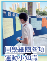
同學細閱各項運動小知識

本校向來著重培養學生的身體和心靈健康，故健康校園學會於午間活動時舉辦「運動知多一點點」活動，讓學生明白和了解如何建立良好的生活習慣。