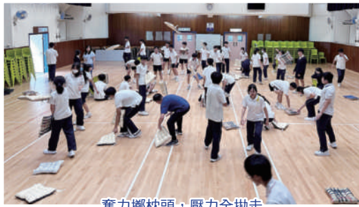
奮力擲枕頭，壓力全拋走

學生會於5月舉辦了浸中Party-game，包括：枕頭防衛戰、拜拜你條尾，以及燒烤聚餐，幫學生減減壓，更有力量迎接考試的挑戰。