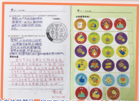
全方位學習日，同學互相欣賞，老師送上品格優勢貼紙