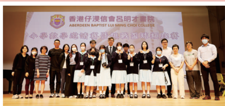
浸中工作人員合照