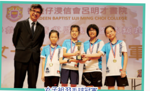
女子組羽毛球冠軍