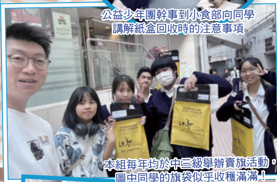
本組每年均於中三級舉辦賣旗活動，圖中同學的旗袋似乎收穫滿滿！