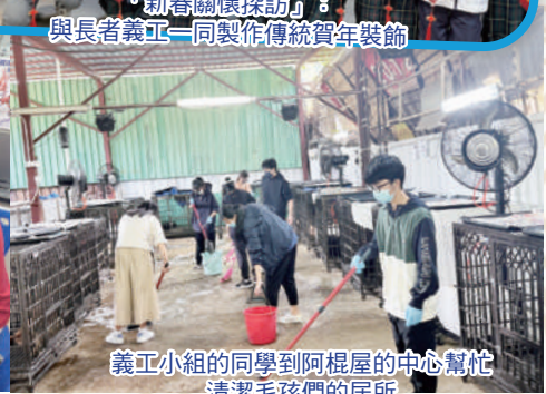
義工小組的同學到阿楓屋的中心幫忙清潔毛孩們的居所