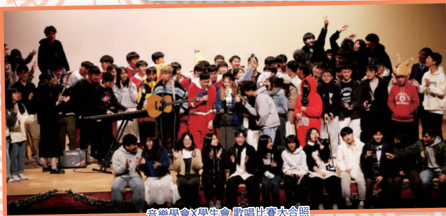
音樂學會X學生會 歌唱比賽大合照

音樂學會及學生會合辦的歌唱比賽決賽於去年12月圓滿結束。是次比賽分為個人和團體組，經過三場激烈初賽後，挑選出五強進入決賽。比賽邀請了校友及李嘉凌小姐作為表演嘉賓，氣氛熱鬧。