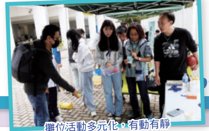
攤位活動多元化，有動有靜