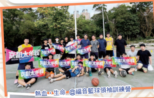
熱血·生命 @福音籃球領袖訓練營