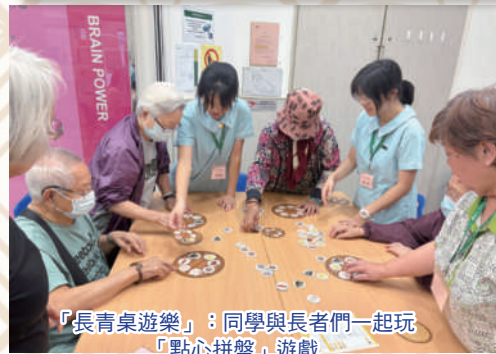
「長青桌遊樂」：同學與長者們一起玩「點心拼盤」遊戲