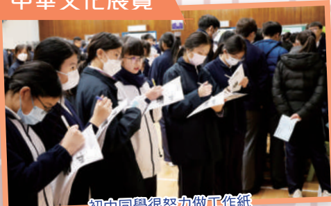
初中同學很努力做工作紙