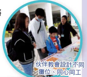
伙伴教會設計不同攤位，同心同工

(4) 啟發美滿婚姻課程 (Alpha Marriage Course)：幫助夫妻建立良好關係，共建和諧家庭。