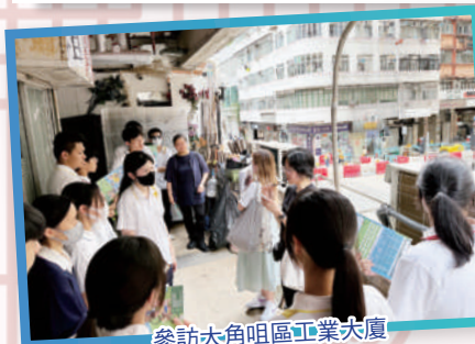
參訪大角咀區工業大廈