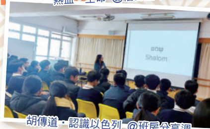
胡傳道·認識以色列 @班房分享週