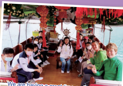
We are having a great time on the sampan!

This photo is optional. If there is insufficient space in the newsletter, this photo can be omitted. Thank you :)