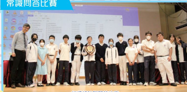
初級組社際問答比賽