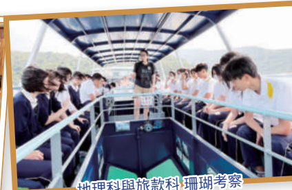
地理科與旅款科 珊瑚考察