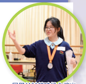
同學於試鏡時投入演出

感謝神！浸中在過去50年來盛載豐厚神恩，宗教部老師聯同校長懷着獻呈的心，鼓起幹勁，創作一首感恩詩歌。除了慶祝浸中50周年外，我們很想合力各展恩賜才幹，同心獻上這份讚頌的祭。願一顆感恩的心，和一切榮耀、頌讚都歸與創始成終的神！