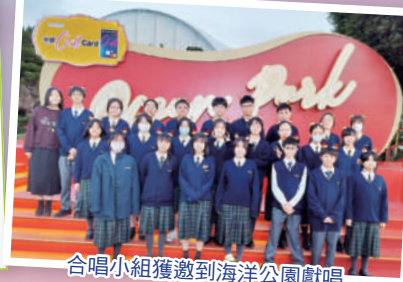
合唱小組獲邀到海洋公園獻唱