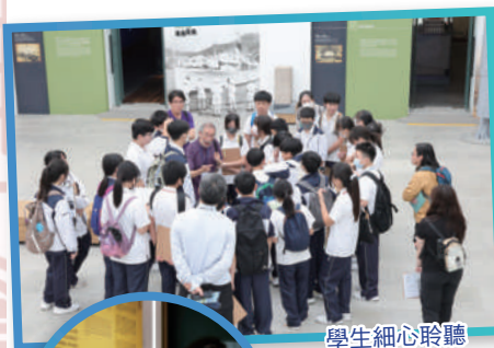
學生細心聆聽導賞員的講解