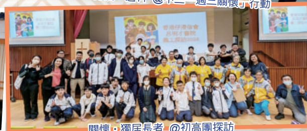
關懷·獨居長者 @初高團探訪