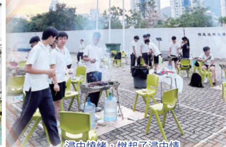
浸中燒烤，燃起了浸中情