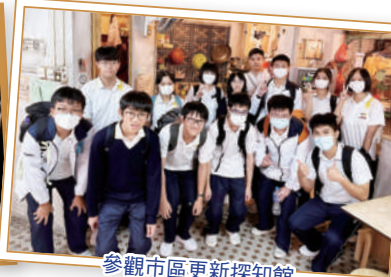
參觀市區更新探知館