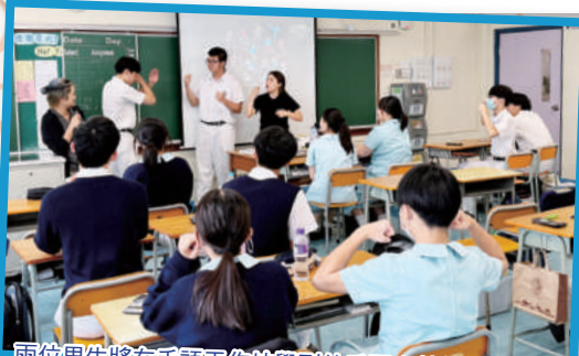
兩位男生將在手語工作坊學到的手語向其他同學示範