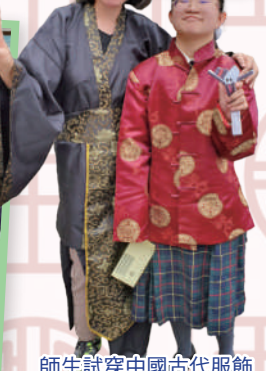
師生試穿中國古代服飾