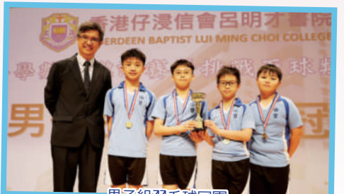
男子組羽毛球冠軍