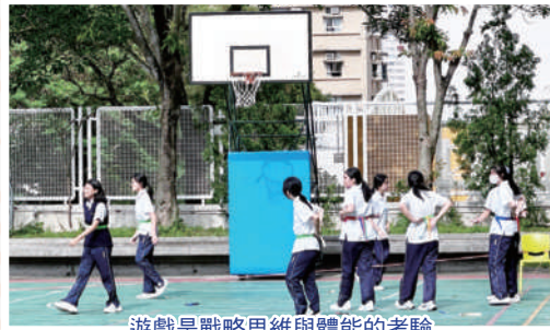
遊戲是戰略思維與體能的考驗