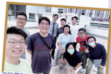
老師們到仔浸「尋根之旅」進行活動考察

此活動於12/4/2025舉行，以飲水思源為念，於五十周年金禧校慶之際，回到香港仔的創校校址及學校所屬教會，尋找浸中的根。各學生組織或代表由浸中出發，以各自不同的方法到達香港仔浸信會舊校校址。抵達仔浸後，將安排參觀及分享，回憶昔日舊校的各種生活點滴。