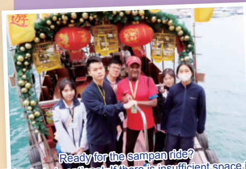
Ready for the sampan ride?

Undoubtedly, Aberdeen Tour was an engaging activity which allowed our students to learn English in an authentic learning environment and become more well-rounded.