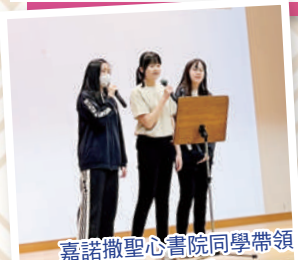
嘉諾撒聖心書院同學帶領長者唱歌