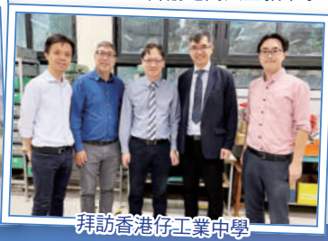
拜訪香港仔工業中學