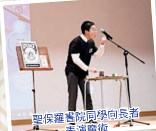
聖保羅書院同學向長者表演魔術