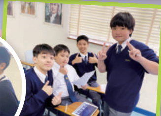
中三級同學運用電子學習工具，分組為皮影戲創作中樂配樂