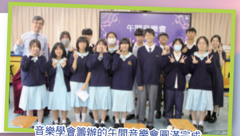
音樂學會籌辦的午間音樂會圓滿完成

音樂教育除了從課堂上發展同學的創造力和評賞音樂的能力，亦透過各類型的音樂活動，培養同學對音樂的終身興趣。本科組舉辦的課外活動包括：合唱小組、樂器班和管樂團。同時，音樂學會亦舉辦各種音樂表演活動及比賽讓同學發揮所長。