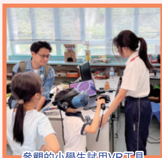
參觀的小學生試用VR工具

回顧這三年，在電子教學方面，由最初較少使用，到現今大部分同事已習慣使用不同電子教學平台於課堂教學，提升學生學習動機，參與課堂及利用Teams學生自學平台，具見成效。透過多次同事實戰經驗分享，工作坊等，提升同事教學信心，建立團隊合作。在STEAM方面，透過跨科協作、STEAM元素的課程、STEAM活動日、對外參賽等，有效建立電子學習的氛圍、提升學生對STEAM興趣及自學能力。