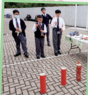
同學嘗試古代文人玩意「投壺」