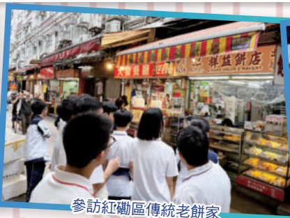
參訪紅磡區傳統老餅家