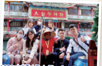
How special Tai Pak Floating Restaurant is!

Our students also found the experience invaluable as they advanced their speaking skills and gained much confidence in communicating in English. More importantly, they broadened their horizons through exchanging their views with the visitors and learning about the culture of their countries.