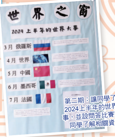
第二期：讓同學了解2024上半年的世界大事，並設問答比賽鼓勵同學了解相關資料