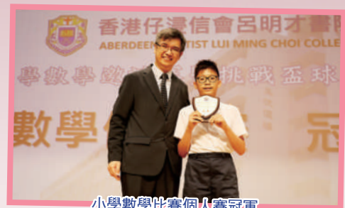
小學數學比賽個人賽冠軍