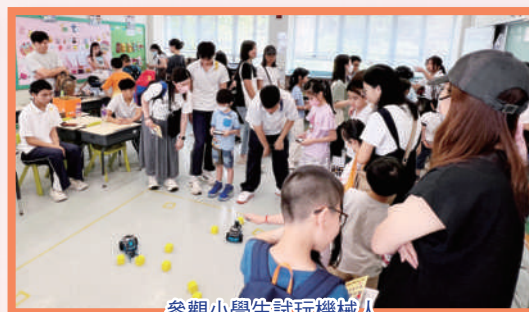
參觀小學生試玩機械人