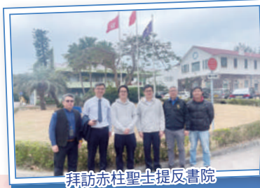
拜訪赤柱聖士提反書院