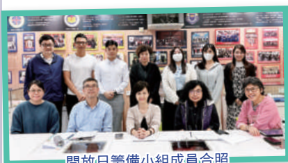
開放日籌備小組成員合照

2024年12月6-7日將舉行50周年校慶典禮暨開放日。感謝校董會邀請，教育局局長蔡若蓮博士，JP應邀出席五十周年校慶典禮並擔任主禮嘉賓及致辭。開放日籌備小組已密鑼緊鼓策劃調整整個活動，大家同心同行一起籌備典禮及開放日活動。