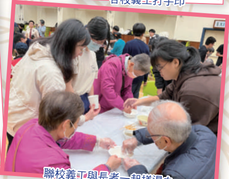
聯校義工與長者一起搓湯丸