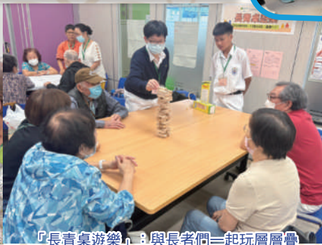
「長青桌遊樂」：與長者們一起玩層層疊