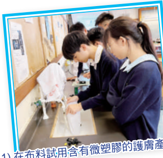
1) 在布料試用含有微塑膠的護膚產品

於11月16日舉辦了「微塑膠工作坊」，讓同學了解到微塑膠在日常生活中無處不在，鼓勵同學避免使用含有微塑膠的產品。