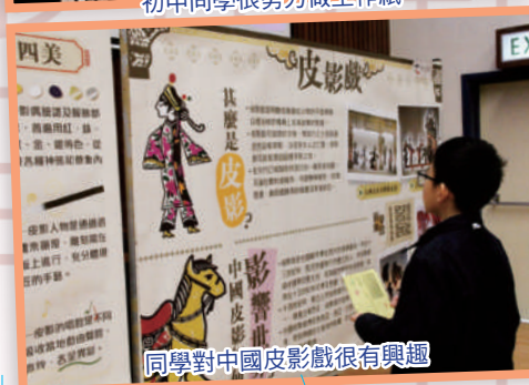
同學對中國皮影戲很有興趣