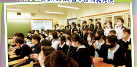
午間音樂會反應熱烈，每場都座無虛席