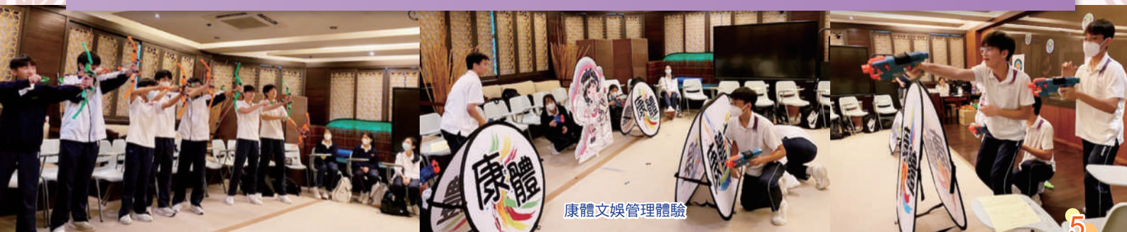
康體文娛管理體驗

在下一學年，專才學習科將易名為「體驗式學習課程」，並由現時只供部份中四班別修讀，改為全級中四學生的必修課程。透過不同類型的體驗活動，更加豐富學生的學習經歷，增廣見聞，以助學生發掘個人興趣，反思及深化所學，從而促進學生全人發展。