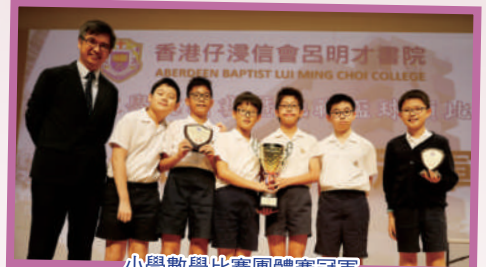
小學數學比賽團體賽冠軍