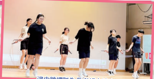
浸中跳繩隊為長者傾力演出