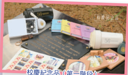
校慶紀念品 (第一階段)