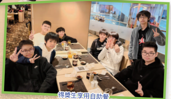
得獎生享用自助餐