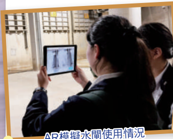
AR模擬水閘使用情況

為增進學生對地理學習的興趣，我校提供理論與實踐並重的地理教學，更為修讀地理的同學安排不同野外考察，如：參觀地質公園，港大地質博物館和市區更新探知館；到林地考察，與旅款科合辦珊瑚考察，以AR模擬水閘使用情況和試用先進儀器—激光測距儀等。