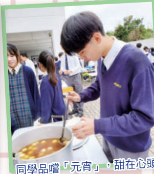
同學品嚐「元宵」，甜在心頭