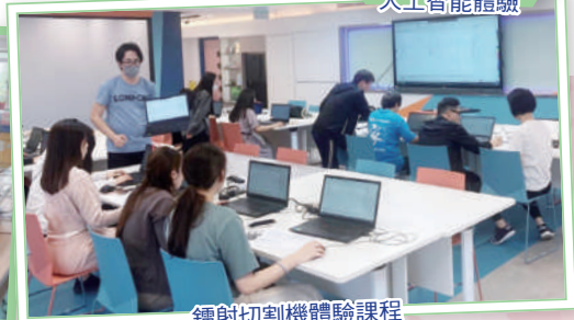
鐳射切割機體驗課程