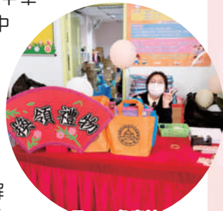
開放日——負責接待及派禮物的浸中學生

每年的試後活動期間，生涯規劃組又會與白光幼稚園合辦工作體驗計劃。為學生提供在幼教機構實際工作的機會，實地了解行業的工作性質、發展和路向。