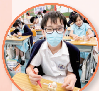
學生設計自己的木頭人，顯出其優點

過去三年來，疫情一直環繞著浸中學生的學習生活。他們被困在家中上網課，失去參與課外活動的機會，不用說，連其他學習經歷都基本上也是完全沒有的。學生缺乏校園生活，減少了與同學的相處接觸和交流，令他們的潛能都被隱藏了。