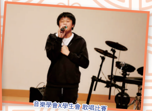
音樂學會X學生會 歌唱比賽