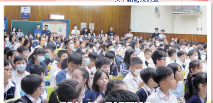
禮堂座無虛席一同參與頒獎典禮