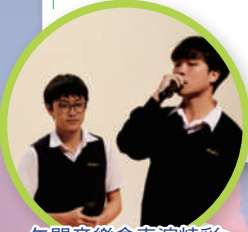
午間音樂會表演精彩