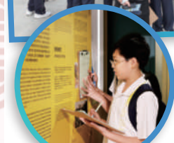
學生通過閱讀展板上的資料以完成跨學科工作紙