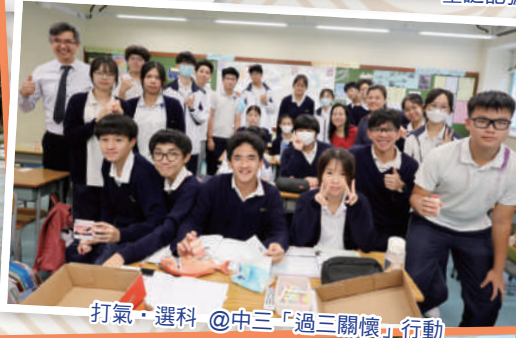
打氣·選科 @中三「過三關懷」行動