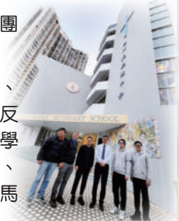
拜訪屯門天主教中學

香港仔工業學校（3/11/2023）、瑪利灣學校（18/12/2023）、聖士提反書院（16/1/2024）、屯門天主教中學（16/1/2024）、顯理中學（16/1/2024）、元朗商會中學（18/6/2024）及聖公會聖馬可中學（7/7/2024）。