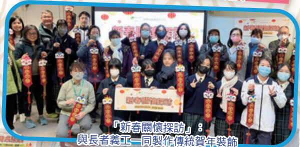
「新春關懷探訪」：與長者義工一同製作傳統賀年裝飾

義工小組的導師們為義工小組會員物色不同類型的義工活動，服務社會上的不同群體。活動具有中華文化元素，富趣味之餘亦別具意義。