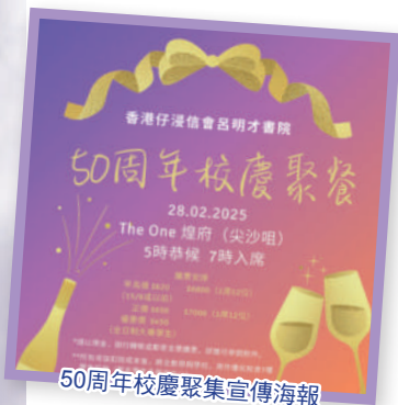
50周年校慶聚集宣傳海報

2025年2月28日將舉行校慶聚餐，誠邀不同年代的浸中人及同工一同出席歡聚，同證主恩！