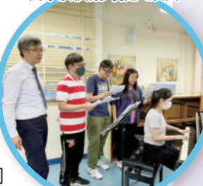
校長、老師努力試唱主題曲