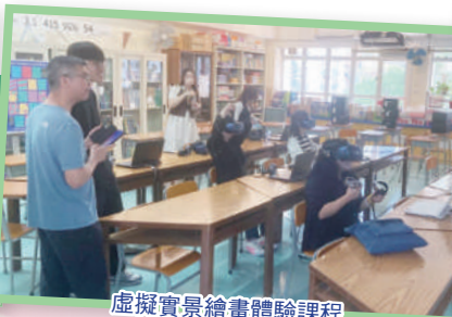
虛擬實景繪畫體驗課程