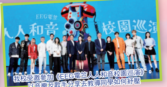
我校受邀參加《EEG電燈人音校園巡演》，以音樂及歌手分享去教導同學如何紓壓