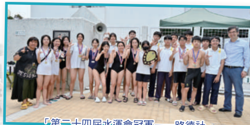
「第二十四屆水運會冠軍——路德社」