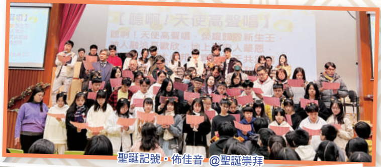
聖誕記號·佈佳音 @聖誕崇拜

宗教組本年學習分題為「跟隨耶穌」，《聖經》約翰福音8章12節：「耶穌又對眾人說：『我是世界的光。跟從我的，就不在黑暗裡走，必要得著生命的光。』」本組透過舉辦不同的基督教教育活動，盼望讓同學、家長、老師認識 神愛世人的福音，又願學生接受救恩，活出愛神愛人的豐盛生命。