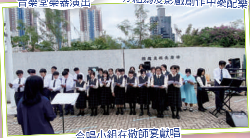
合唱小組在敬師宴獻唱