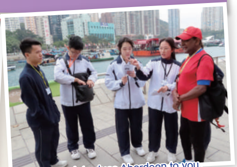
Let us introduce Aberdeen to you.