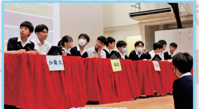
高級組社際問答比賽