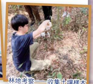
林地考察——收集土壤樣本