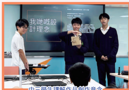
中三學生講解作品創作意念