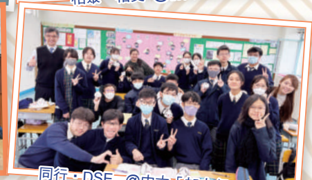
同行·DSE @中六「加力仔」行動