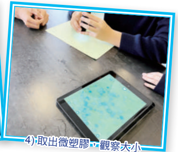
4) 取出微塑膠，觀察大小