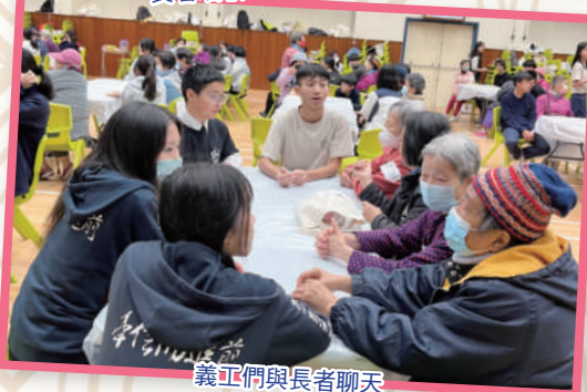
義工們與長者聊天