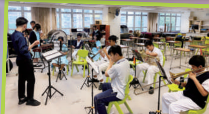
管樂團為畢業典禮努力排練